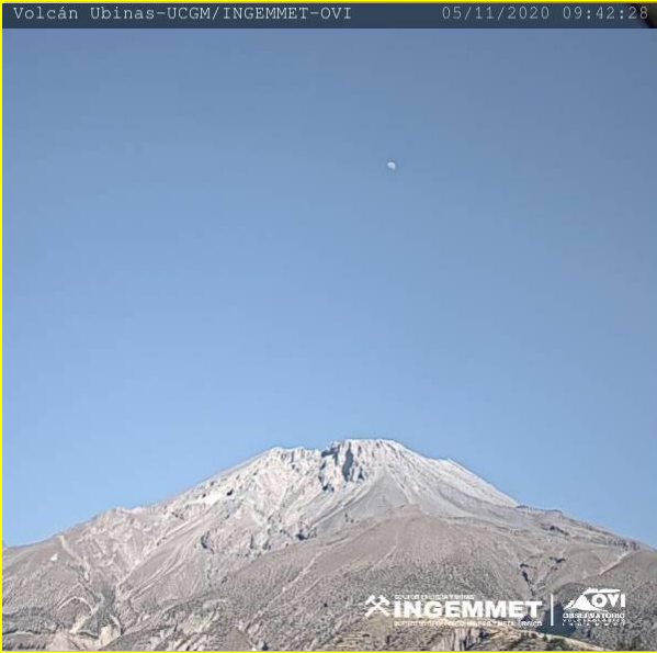
IMAGEN DE MONITOREO VISUAL EN TIEMPO REAL