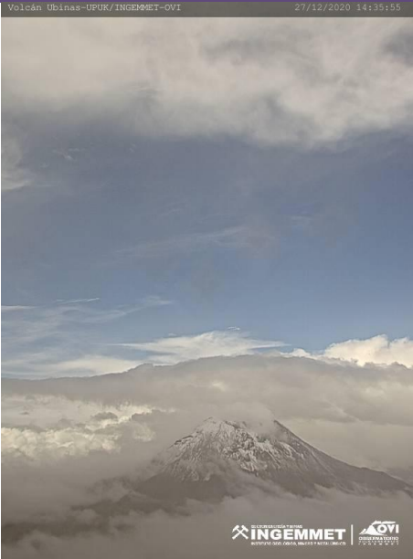
IMAGEN DE MONITOREO VISUAL TIEMPO REAL

RSUBN-52-2020/DGAR-INGEMMET Semanal: del 21 al 27 de diciembre del 2020