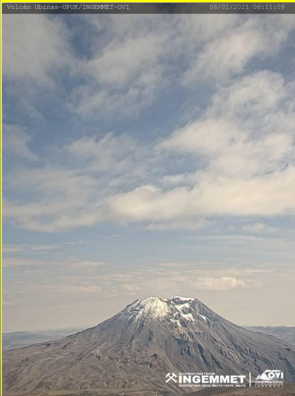
VISTA DEL CRATER DEL VOLCAN UBINAS