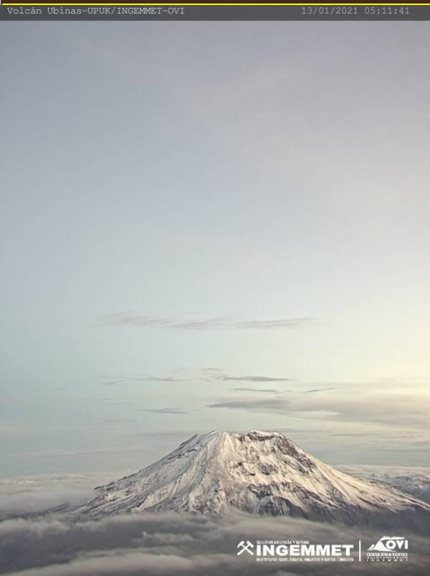
IMAGEN DE MONITOREO VISUAL EN TIEMPO REAL