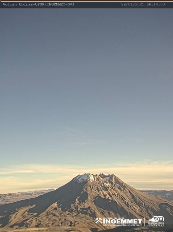
VISTA DEL CRATER DEL VOLCAN UBINAS