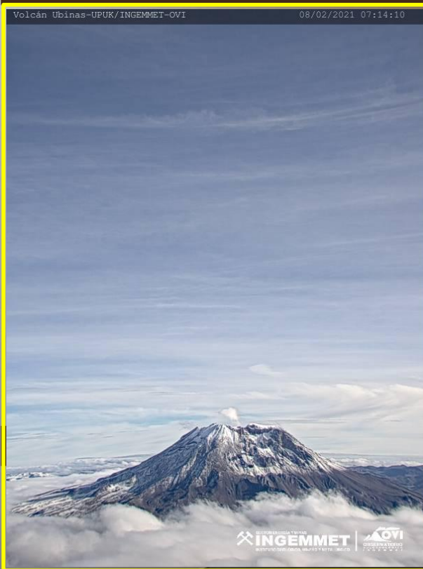
VISTA DEL CRATER DEL VOLCAN UBINAS