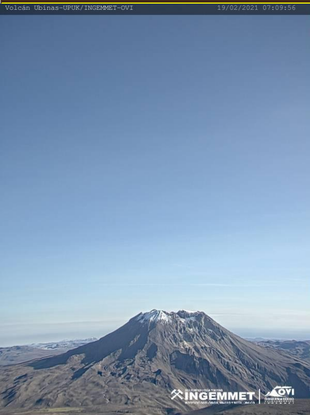
VISTA DEL CRATER DEL VOLCAN UBINAS