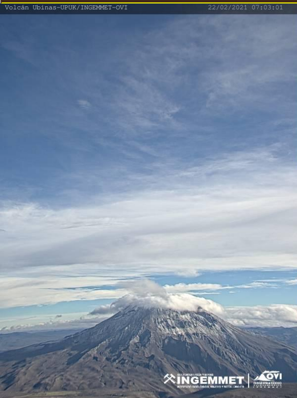
VISTA DEL CRATER DEL VOLCAN UBINAS