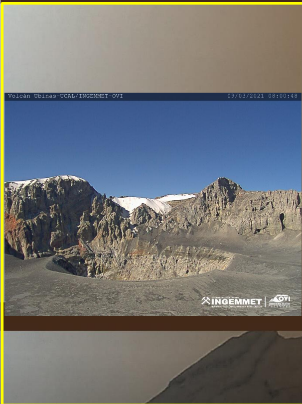
IMAGEN DE MONITOREO VISUAL EN TIEMPO REAL