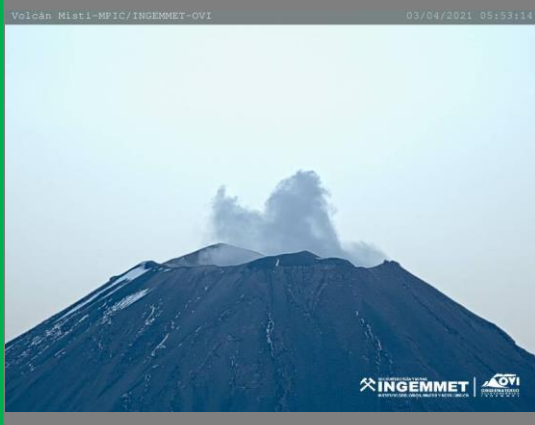
IMAGEN DE MONITOREO VISUAL