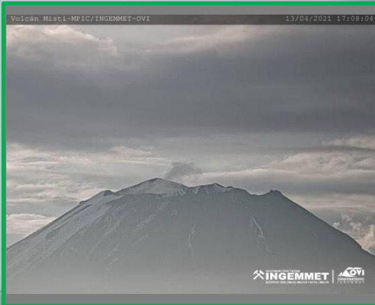
IMAGEN DE MONITOREO VISUAL