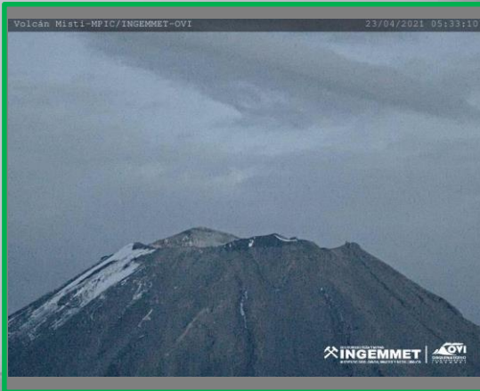
IMAGEN DE MONITOREO VISUAL