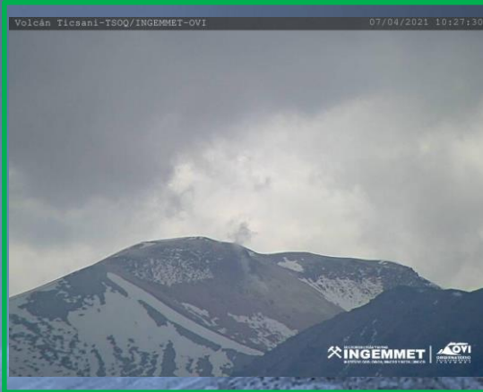
IMAGEN DE MONITOREO VISUAL