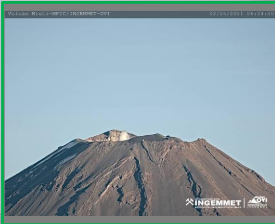
IMAGEN DE MONITOREO VISUAL