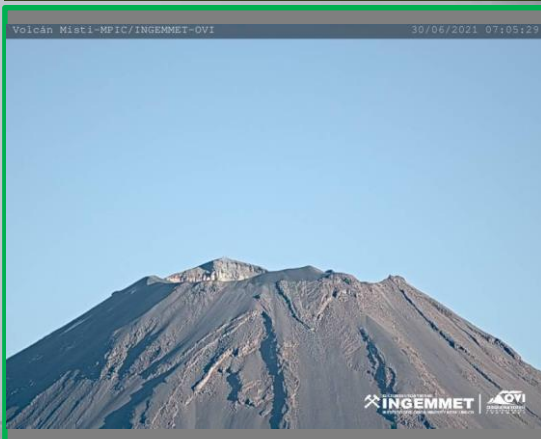
IMAGEN DE MONITOREO VISUAL