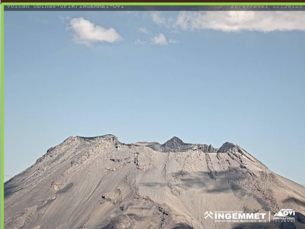
IMAGEN DE MONITOREO VISUAL EN TIEMPO REAL