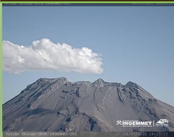
IMAGEN DE MONITOREO VISUAL EN TIEMPO REAL