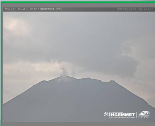
IMAGEN DE MONITOREO VISUAL