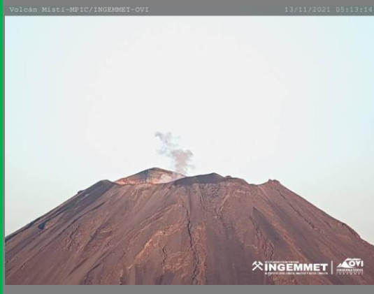
IMAGEN DE MONITOREO VISUAL