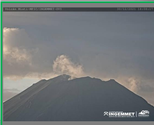
IMAGEN DE MONITOREO VISUAL