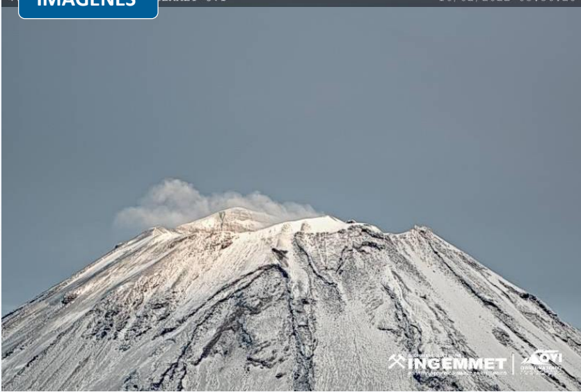
Volcán Misti-MPIC/INGEMMET-OVI 16/02/2022 05:58:21